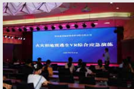
8月19日,研究院公司开展了火灾和地震逃生VR综合应急演练。据悉,此次应急演练为安全生产百日整治行动期间一次重要演练活动。