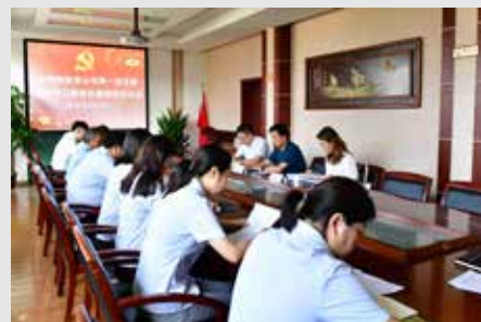
8月18日,中煤新能源公司第一党支部召开党史学习教育专题组织生活会。集团第八巡回指导组组长、副总经理杨文海到会指导。