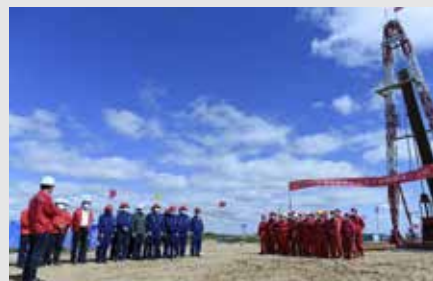
8月25日上午,一八五公司梅林庙井田补勘项目开钻仪式在内蒙乌审旗举行。