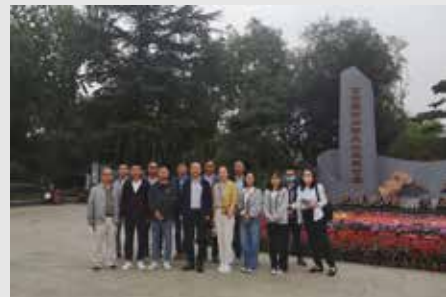
9月29日,全省首家廉洁文化主题公园“西安莲湖廉洁文化主题公园”揭牌开园,物测公司纪委组织党员干部参观,为党员干部上了一堂廉洁教育“必修课”。