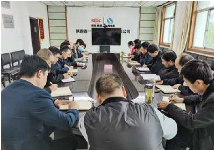
质灾害防治工作，始终坚持“人民至上、生命至上”