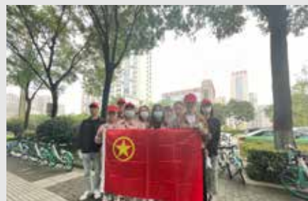
9月29日,研究院公司团支部开展“请党放心 强国有我”主题团日志愿服务活动。