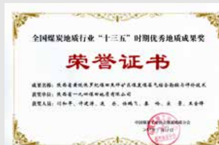
近日,一九四公司《陕西省黄陇侏罗纪煤田焦坪矿区煤炭煤层气综合勘探与评价技术》荣获全国煤炭地质行业“十三五”时期优秀地质成果奖。